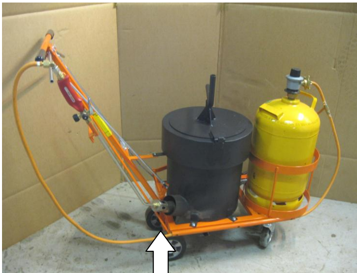
Gassoppvarmet fugevogn FV20 med 2 varmesoner

Gassoppvarming av beholder sikrer riktig temperatur på fugemassen under utlegging.